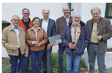
Köllamaunna & Grean: als UNESCO Kuturerbe

Wie jedes Jahr sind Dirndl & Lederhose gerne gesehen!