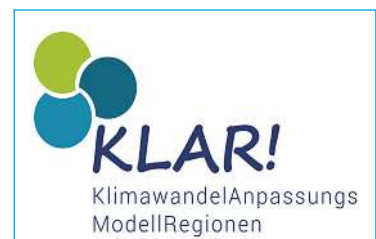
Podiumsdiskussion „Klimawandel im Pulkautal“