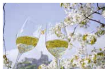
Weintour Weinviertel im Pulkautal