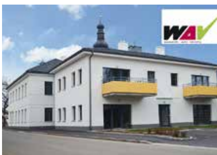
Betreutes Wohnen in Obritz

Jede Wohnung verfügt über eine eigene Terrasse bzw. Loggia und jeder Wohneinheit ist ein PKW-Stellplatz zugeordnet. Direkt beim Eingang ist der Fahrrad-/ Kinderwagenabstellraum situiert.