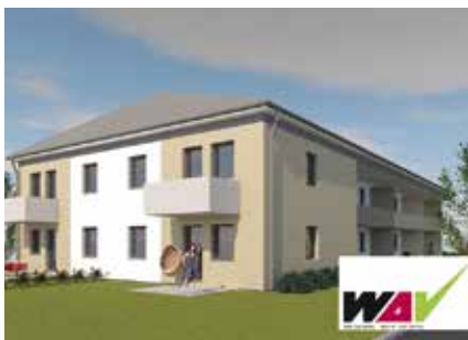
Junges Wohnen in Obritz

Junges Wohnen ist eine speziell für junge Menschen ausgerichtete Förderschiene, die den problemlosen Schritt zum eigenständigen Leben ermöglicht. Ein geringer Finanzierungsbeitrag von € 3.800,- und kostengünstige Mietpreise machen diese Wohnungen für junge Menschen leistbar.