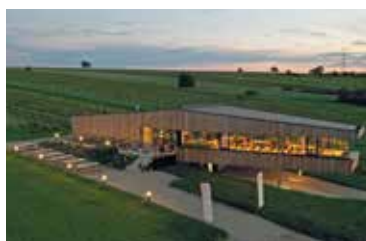
Weingarten.rocks ist "TOP-Heuriger"

Sonntag, 6. Oktober 2019, Beginn jeweils um 14 Uhr in den Kellergassen Peigarten, Jetzelsdorf, Haugsdorf, Alberndorf, Seefeld-Kadolz, Mailberg