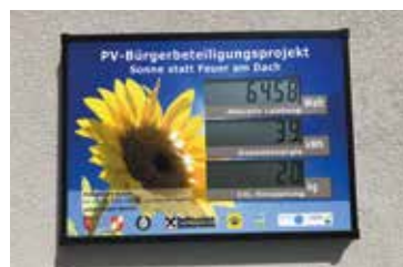
Sonne statt Feuer am Dach