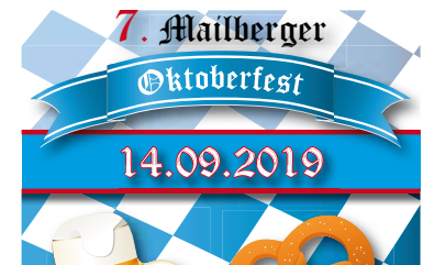
7. Oktoberfest der FF Mailberg