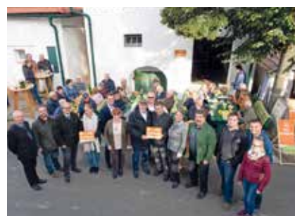
Alberndorf: Kellertrift Familie Rain