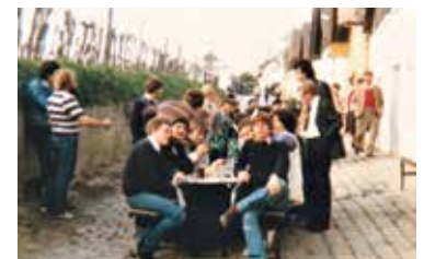
In die Green geh'n ist auf der Liste der UNESCO Weltkultur