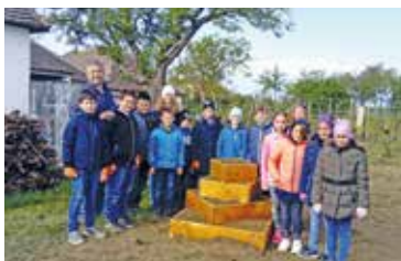
Schüler entwickeln einen Schauweingarten