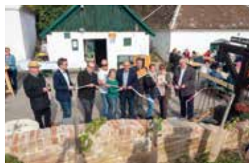
Eröffnungsfeste der Keller-Wohlfühlplätze