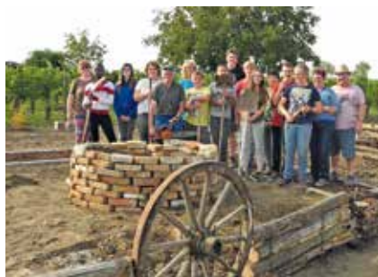
Hadres: Neue Mittelschule