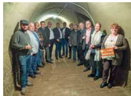
Großkadolz: gegenüber der Vinothek Gemeinde Seefeld-Kadolz