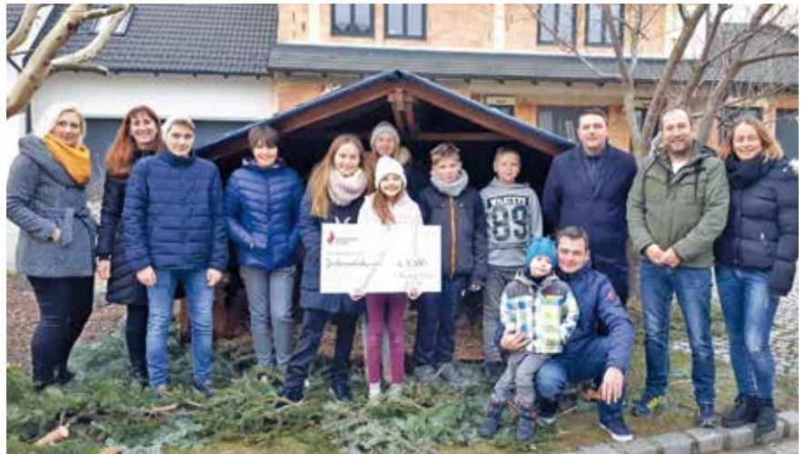
stützen Sie mit Ihrem Besuch das St. Anna Kinderspital. Samstag, 21. Dezember 2019 Beginn: 15 Uhr

Beginn des diesjährigen Adventarktes ist um 15 Uhr. Die Trumauerstrassler werden Sie wieder mit hausgemachten Mehlspeisen, Kinderpunsch und Glühwein verwöhnen. Wir freuen uns auf Ihr Kommen und wünschen eine besinnliche Vorweihnachtszeit. Genießen Sie ein paar gemütliche Stunden und unter-