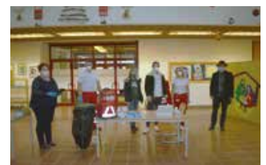
Corona-Teststraßen in Haugsdorf & Hadres