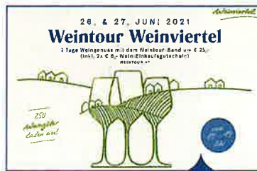
26. und 27. Juni 2021 Weintour Weinviertel