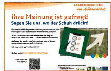
Umfrage: Gemeinsam die Zukunft gestalten!