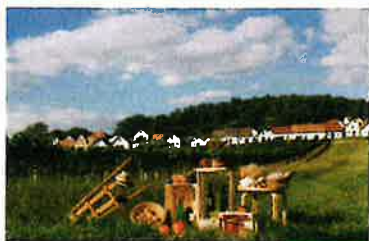
Sommer-Genusstour im Weinviertel

Sehr geehrte Leserinnen und Leser, wir bedauern sehr, dass uns die Corona-Pandemie leider dazu zwingt, auch 2021 Ein Tal am Rad und den Polt-Radwandertag abzusagen.