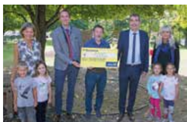
Spende für KIGA Pernersdorf