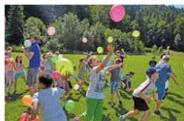
Neuer Pfarrverband Pulkatal