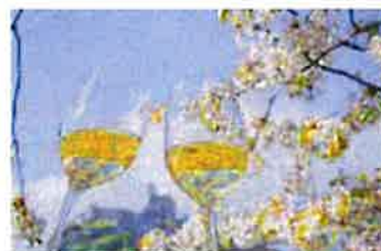
Weintour Weinviertel 23. u. 24. April 2022