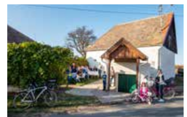
Auftakt Kellerwohlfühlplätze Seite 17