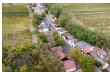
Kellergassen Bauberatungen Seite 16

Samstag, 1. April – 15 - 19 Uhr & Sonntag, 2. April – 14 - 18 Uhr