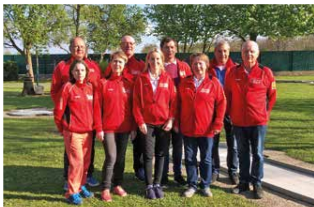
Die Mitglieder des Minigolfvereins Seefeld-Kadolz