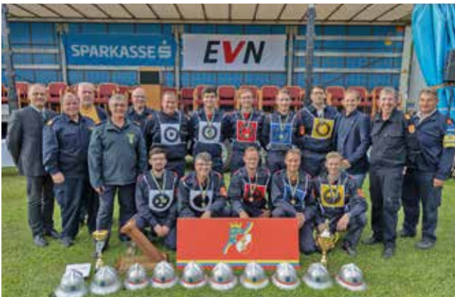
Die siegreiche FF Alberndorf