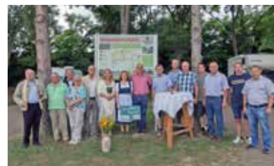
Eröffnung des Wohnmobilstellplatzes