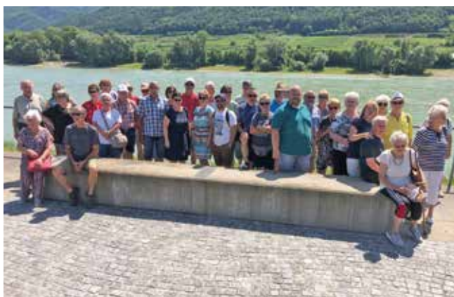
Ausflug des Fremdenverkehrsvereins in die Wachau

Eine Festschrift, die 50 Jahre Fremdenverkehrsverein Seefeld-Kadolz dokumentiert und chronologisch aufarbeitet wird ebenso aufgelegt werden.