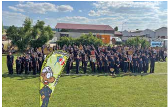
Die Feuerwehr Jugendgruppen des Bezirkes