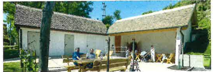
Auftakt der Keller-Wohlfühlplätze ab Ostermontag in den Pulkautaler Kellergassen.

Der Versand der Wahlkarte beginnt knapp drei Wochen vor dem Wahltag. Sie können die Stimme sofort nach Erhalt der Wahlkarte abgeben und müssen nicht bis zum Wahltag damit warten.