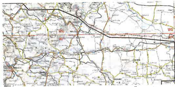
Im Wein- und Waldviertel wird es Ende April zu einer Übung des Bundesheeres kommen.

Während der Übung ist die Verwendung von Knall-, Markier-, Leucht- und Signalmunition nicht vorgesehen.