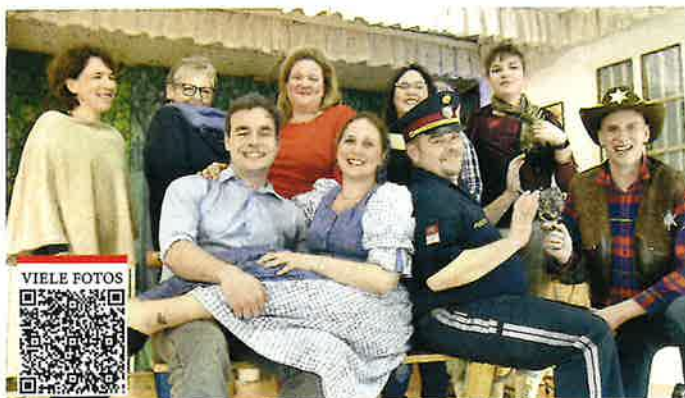
Das Theaterensemble brachte das Publikum mit dem Stück „Geiselnahme für Anfänger in Tatortlänge“ zum Lachen.

Die erfahrenen Darsteller waren bei den Aufführungen im Pfarrzentrum in Hadres voll in Fahrt und brachten die Besucher zur Begeisterung. Die Handlungen wurden von den Darstellern „pulkautalerisch“ angepasst.