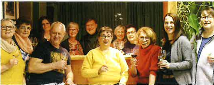
Der Chor empfängt zusätzliche Sängerinnen und Sänger mit offenen Armen. Lust am Singen genügt - komm, sing mit uns.