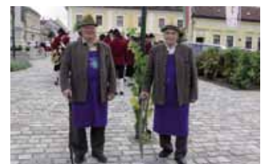
Hütatag in Haugsdorf 10./11. September 2011