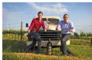
Weingut Hagn - Mailberg: Winzer des Jahres 2011