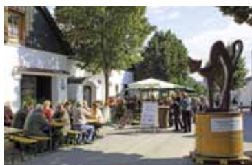
Weinfest & Bauernmarkt in Alberndorf: 3./4. September

Am 10. September 2011 um 10 Uhr findet die offizielle Eröffnungsfeier im JUFA-Gästehaus in Seefeld-Kadolz statt.