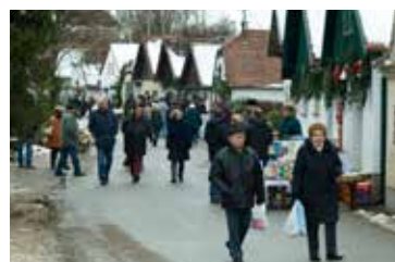
28. Adventtreffen in der Hadreser Kellertrift