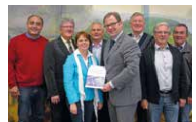
Klima- und Energieregion Pulkautal