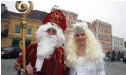
„Show der Sinne“ Pulkau, Stadtsaal

Sa. 8. / So. 9. Dezember Advent drüber & drunter ab 13 Uhr, Retz - Hauptplatz