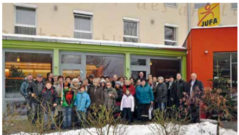
die FV-Mitglieder vor dem Quartier, des JUFA Gästehauses Salzburg

Alle Teilnehmer konnten sich von den wunderschönen Adventmärkten in St. Wolfgang, Strobl, St. Gilgen, Salzburg und Christkindl auf das bevorstehende Weihnachtsfest einstimmen lassen. Als Abschluss fand ein gemütlicher Ausklang beim Heurigen Greilinger in Schöngrabern statt.