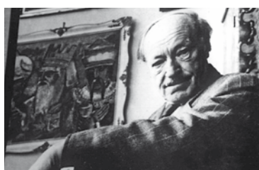
Zülow-Gedenkjahr: heuer jährt sich der 130. Geburtstag des Malers Seite 4