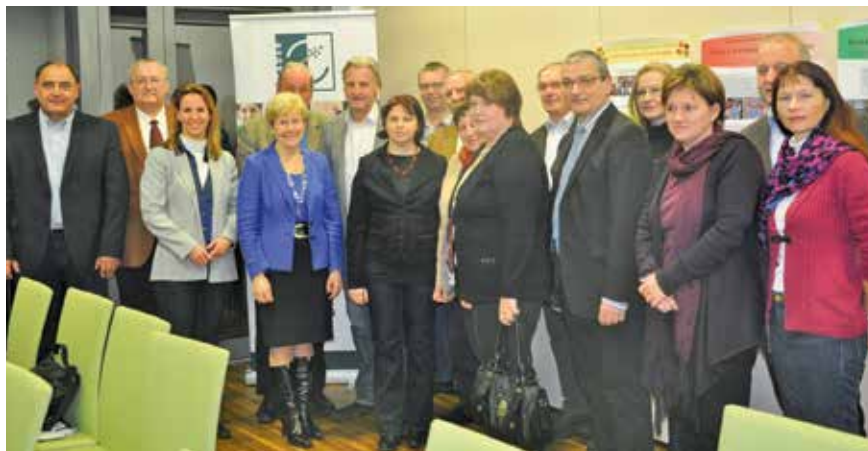
Der LEADER Vorstand ist stolz auf die beachtliche Summe, die über LEADER in die Region gebracht werden konnte.