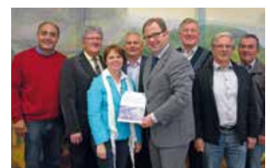
Kleinregion Pulkautal ist Klima- und Energiemodellregion Seite 2