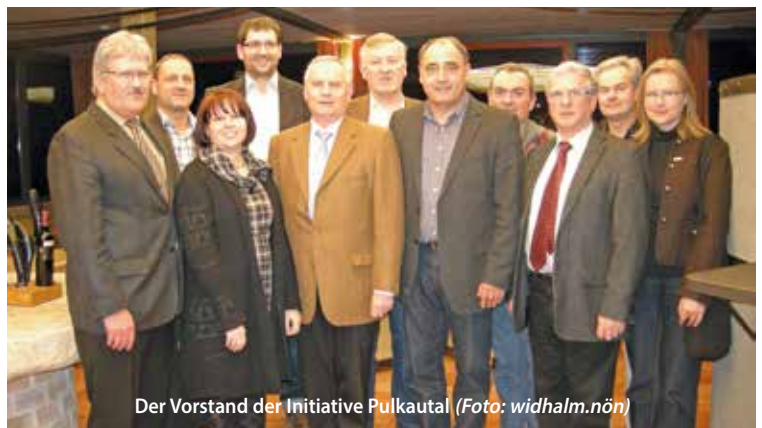
Der Vorstand der Initiative Pulkautal

Werden noch Erhebungsbögen benötigt, erhalten Sie diese bis Ende April 2013 im Büro der Initiative Pulkautal in Haugsdorf oder in Ihrem Gemeindeamt! Bitte die Fragebögen in Ihrem Gemeindeamt oder im Büro Initiative Pulkautal abgeben. Wir ersuchen um weitere Beteiligung an dieser wichtigen Umfrage!