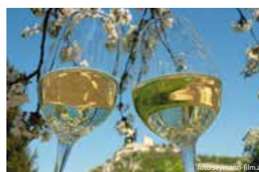
Weintour Weinviertel 2013 im Pulkautal Seite 3