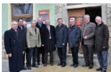
GH Kopp in Mailberg schließt seine Pforten