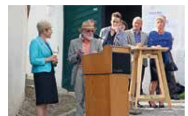
Kunstaussstellung von Eduard Diem