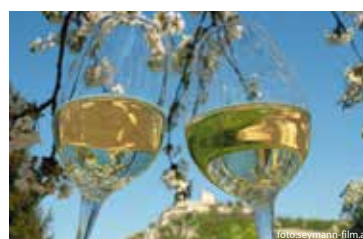
Weintour Weinviertel 2014 im Pulkautal