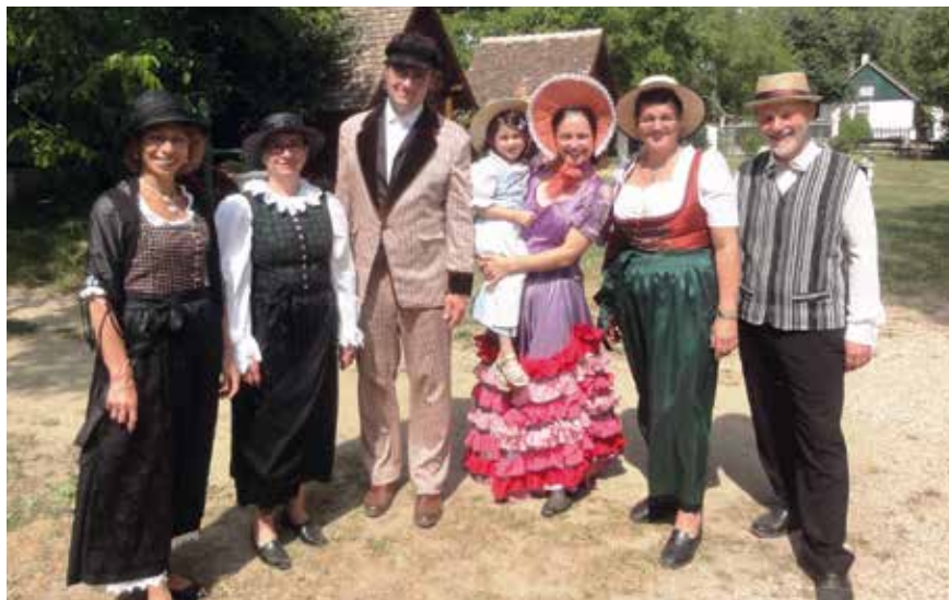
Das Xsångsbouquet, hier als „Biedermeiersextett“, bei einem Auftritt im Romantik – Theater Untermarkersdorf

Die Vielseitigkeit der Gesangsgruppe garantiert ein abwechslungsreiches, gut sortiertes Liedprogramm. Für das Wohlfühlen der Konzertbesucher sorgt das Buffet des DEV. Freuen wir uns auf den Zauber einer besonderen Zeit!