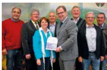
Neues aus der Klima- u. Energiemodellregion Pulkautal Seite 8

Die „Initiative Pulkautal“ wünscht Ihnen und Ihrer Familie ein schönes Weihnachtsfest und viel Glück für 2015!