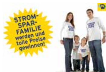
Werden Sie Strom-Spar-Familie Seite 4