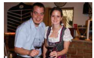
„2 Hauben“ für das Restaurant Schlosskeller im Mailberg Seite 15