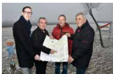
Neues Abfallzentrum in Hadres Seite 6

Weinvergnügen, Gaumenfreuden, Genussradeln und Riedenerlebnis im Pulkautal!