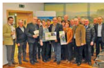
Weiterführung KEM Pulkautal Seite 4