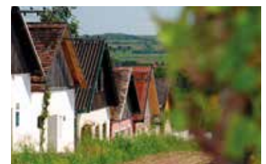
Gewinner Ideenwettbewerb Seite 14