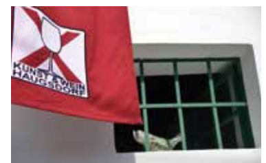
Kunst & Wein in Haugsdorf 19. /20. August