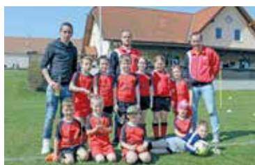
90 Jahre AFC Haugsdorf 28. - 30. Juli

Die Schlussveranstaltung findet um 16 Uhr in Haugsdorf beim FF-Haus statt.