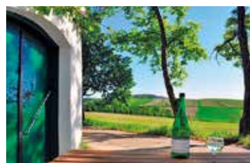
Keller-Wohlfühlplätze im Pulkautal